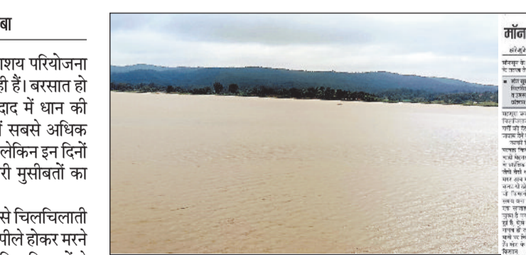
पानी से लबालब भरा खमगड़ा जलाशय।

जिले के सबसे बड़े बांध खमगड़ा जलाशय परियोजना किसानों के लिए वरदान साबित होती रही है। बरसात हो या गर्मियों में यहां के किसान बड़ी तादाद में धान की फसल उत्पादन करते हैं। और जिले में सबसे अधिक धान पैदावार करने वाले क्षेत्र में होता है, लेकिन इन दिनों मानसून की बरखी से किसानों को भारी मुसीबतों का सामना करना पड़ रहा है। पिछले सप्ताह भर से अधिक समय से चिलचिलाती धूप से खेतों में दरारें पड़ गई हैं और धान पीले होकर मरने लगे हैं। इधर समस्या से निजात पाने के लिए किसानों ने जलसंसाधन विभाग को पत्र लिखकर पानी छोड़ने की गुहार लगाई बावजूद किसानों को पानी नहीं मिल रहा है। जबकि बांधों में लबालब पानी भरा होने के बावजूद, किसानों को सिंचाई के लिए पानी नहीं मिल रहा है, जिससे उनकी फसलें सूख रही हैं। किसानों ने पानी की मांग की है, लेकिन उनकी समस्या का समाधान नहीं हुआ है। यह प्रतिक्रिया किसानों के लिए गंभीर चिंता का