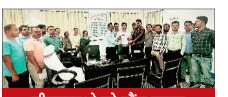
सीएमएचओ को सौंपा ज्ञापन

एनएचएम कर्मियों ने स्थायीकरण ग्रेड पे व बीमा की मांग उठाई