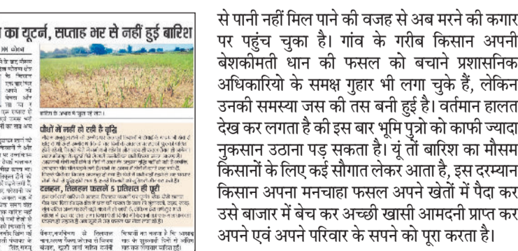
किसानों ने मांग की है कि जल संसाधन विभाग किसानों को पानी उपलब्ध करवाए।

विषय है, क्योंकि पानी की कमी के कारण उनकी फसलें बर्बाद हो रही हैं। बांधों में पानी होने के बावजूद, किसानों को पानी न मिलना जलसंसाधन विभाग का एक विरोधाभास है। किसानों का कहना है कि बांधों में पर्याप्त पानी जमा है, लेकिन किसानों को सिंचाई के लिए पानी नहीं मिल रहा है। सूखी हुई फसलें किसानों की आय और