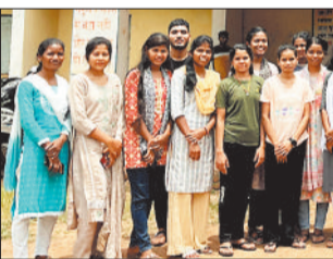
होमगार्ड पद पर चयनित छात्राएं।

बेटियों ने रचा इतिहास, 100 में से 43 पद किए अपने नाम